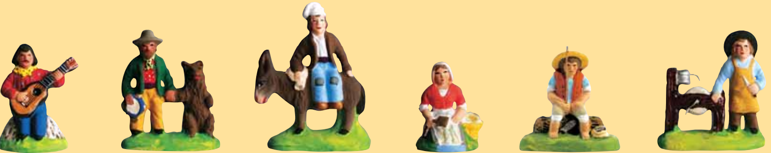
Gitan à la guitare (chemise orange ou verte) Gitan à l'ours Homme sur l'âne Laveuse Pêcheur assis Rémouleur