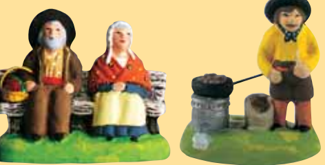
Couple sur le banc Marchand de marrons