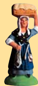
Femme à la morue