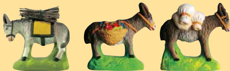
Ane chargé de fagots Ane chargé de fruits Ane chargé de sacs de farine