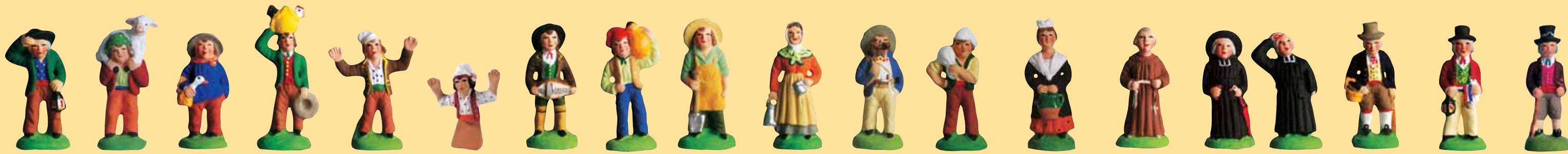
Homme à la lanterne Homme au mouton Homme à l'oie Homme aux poules Homme ravi Homme ravi coupé pour mettre à la fenêtre (rouge ou bleu) Homme à la vielle Homme au vin cuit Jardinier Laitière Marius Meunier Mireille à la cruche (robe bleue, jaune, orange) Moine (bure marron, beige) Monsieur le curé (au parapluie ou au mouchoir) Monsieur Jourdan Monsieur le maire Notaire