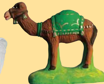
Chameau (tapis vert, rouge, violet, bleu)