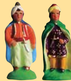
Chamelier (avec ou sans sabre)