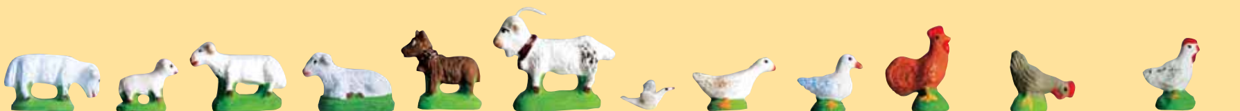
Mouton broutant Agneau Mouton debout Mouton couché Chien Chèvre (blanche, grise ou marron) Colombe Oie Canard Coq (blanc, noir, roux) Poule picorante (grise, blanche, noire, rousse) Poule (grise, blanche, noire, rousse)