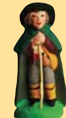
Berger appuyé jeune