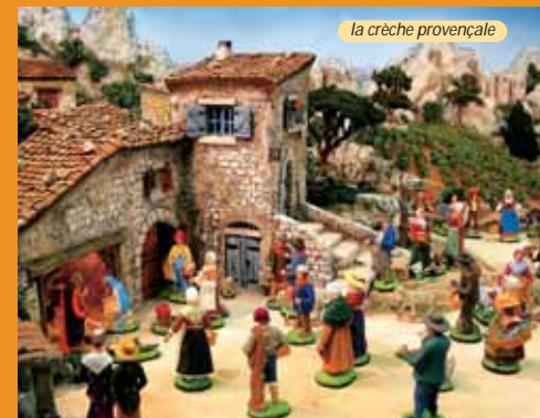
la crèche provençale

Over 800 different hand-painted clay models: the "puces" (25 mm high), N° 1, N° 2, which at 70 mm is the most traditional and popular, N° 3, N° 4, N° 5 size (150 mm/6 inch) the biggest. Santons Marcel Carbonel also produces a range of Provençal "Mas" farmhouses together with country buildings etc.: stables, bridges, "bories" (stone constructions) and fountains etc. So you have all the harmonious accessories guaranteeing the creation of a most beautiful "Crèche" at Christmas-tide.