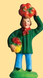
Homme aux fruits