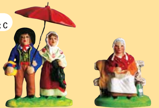
Couple sous le parapluie Femme à l'aïoli