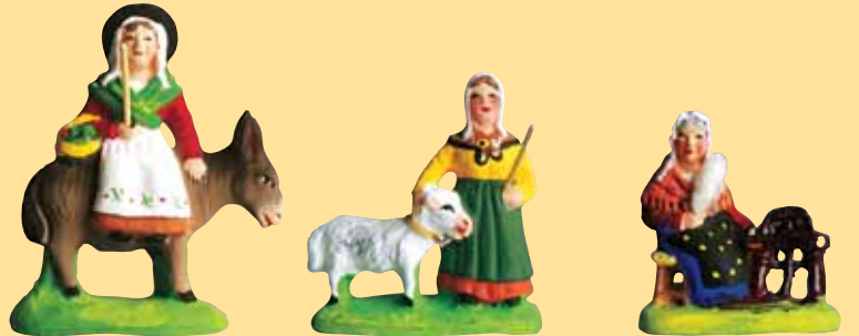
Femme sur l'âne Femme à la chèvre (blanche, grise, marron) Fileuse au rouet