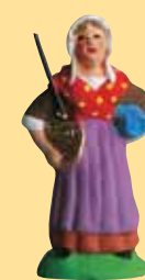
Femme à la bassinoire