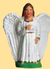
Ange (blanc, bleu, rose)