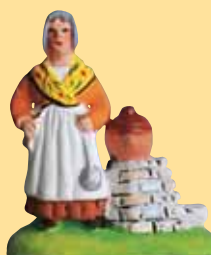
Femme aux limaçons