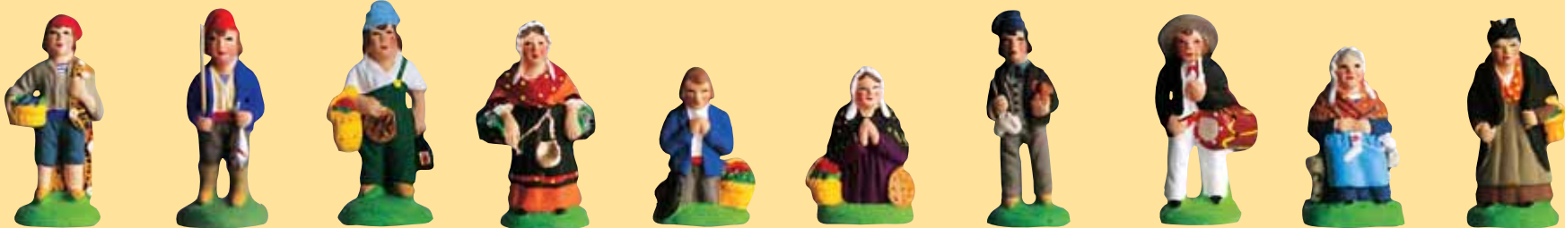
Pêcheur au filet Pêcheur à la ligne Pistachié Poissonnière Prieur Prieuse Ramoneur (bonnet bleu ou rouge) Tambourinaire Tricoteuse Vieille arlésienne