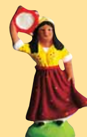
Gitane (jupe rouge ou verte)