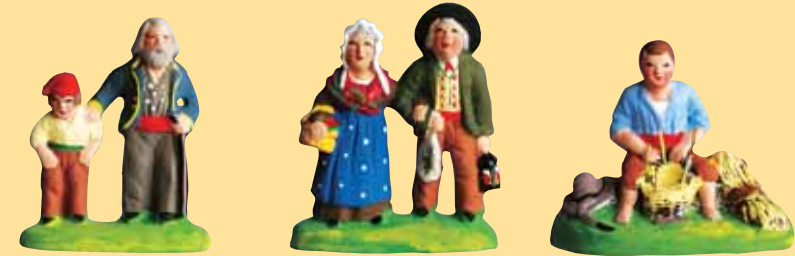
Aveugle et son fils Couple de vieux Vincent le vannier