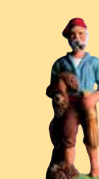
Pêcheur au poulpe