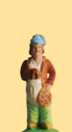
Mitron (enfant boulangier)