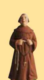
Moine (bure marron, beige)