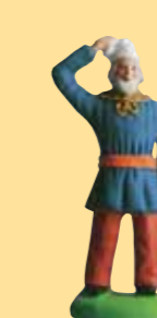
Homme aux fruits