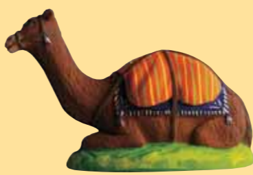
Chameau couché (tapis jaune, orange)