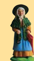
Femme au Calen