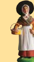
Femme à la brousse