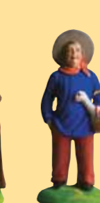
Homme au mouton