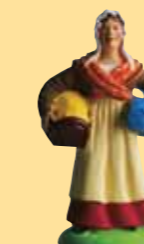
Femme au berceau