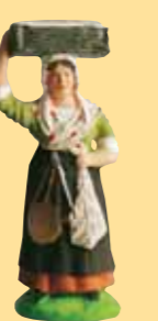
Femme à la morue