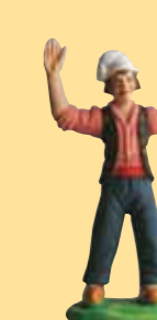
Homme aux poules