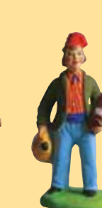
Homme à la vielle