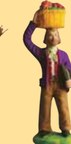
Homme au fagot