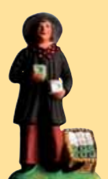
Homme aux savons