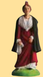
Arlésienne à la cape (robe bleue, violette, rouge, jaune)