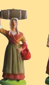
Femme au tonnelet