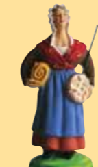
Femme à la bassinoire