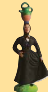
Corse à la cruche