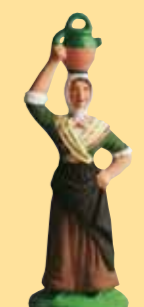
Femme à la cruche