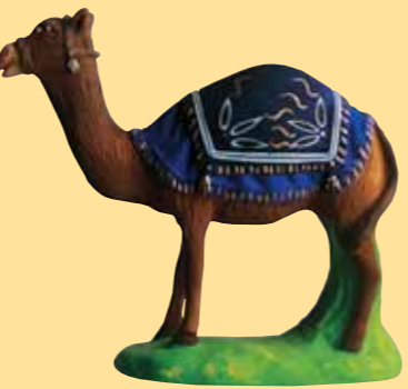
Chameau debout (tapis bleu, violet, rouge)