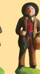
Homme au cochon