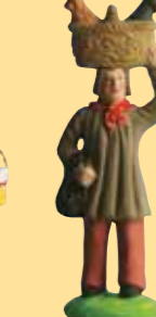
Homme à l'oie