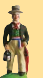
Monsieur le Maire