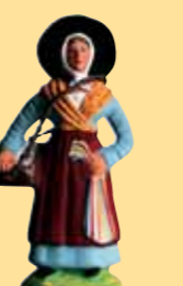
Femme aux rubans (robe bleue ou rose)