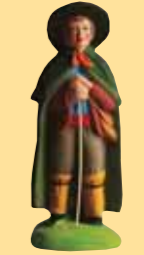
Berger appuyé jeune