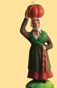
Femme à la courge