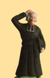
Monsieur le curé (au mouchoir ou au parapluie)