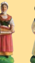
Femme à la vielle