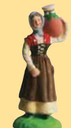
Femme à la jarre