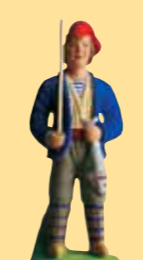
Pêcheur à la ligne