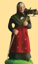
Femme au fagot