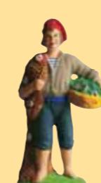
Pêcheur au filet