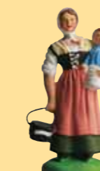
Femme au bébé