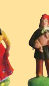
Gitane (disponible fin 2008)