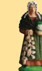
Femme au chou et à l'ail