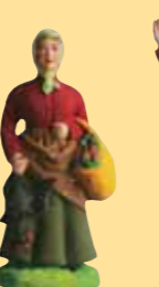
Femme à la poule