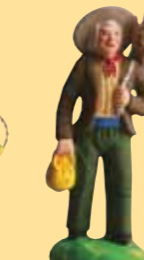
Homme à la dinde