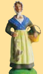
Femme au lapin