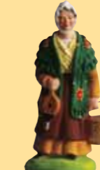
Femme à la chaufferette