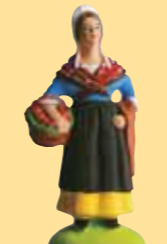
Comtadine aux fruits