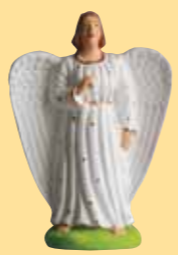
Ange (blanc, bleu, rose)