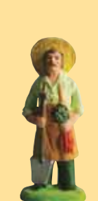
Homme au vin cuit