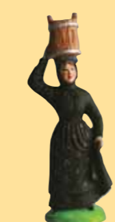
Corse au baquet