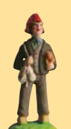
Ramonneur (bonnet bleu, rouge)